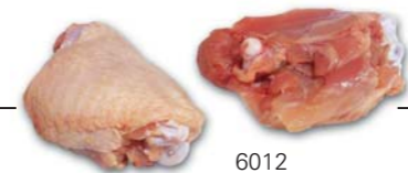
6012 Oberkeule Thigh