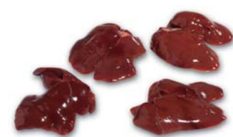
6050 Leber Liver