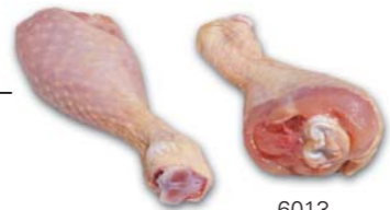
6013 Unterkeule Drumstick