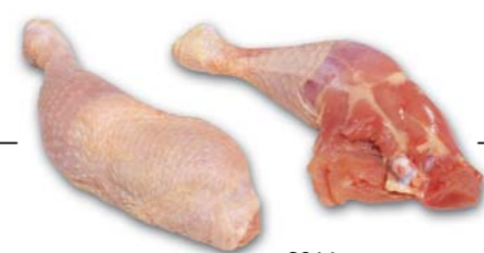
6011 Keule Leg