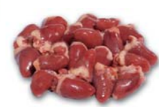
6052 Herz Heart