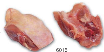
6015 Rücken Back