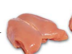
6020 Filet Fillet