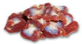
6051 Magen Stomach