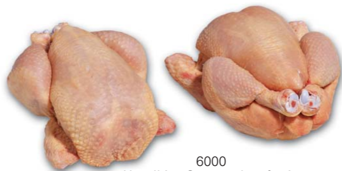
6000 Hendl im Ganzen, bratfertig Hühnchen im Ganzen, bratfertig Chicken, ready to grill