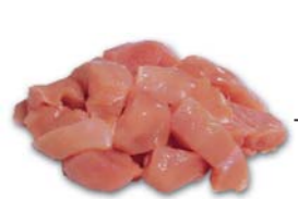
6023 Hühnergeshnetzeltes Chopped chicken